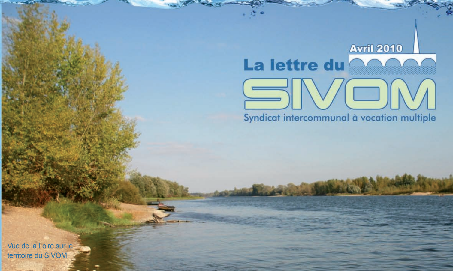
Vue de la Loire sur le territoire du SIVOM